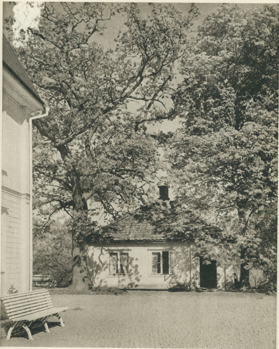
Kontorsflygeln innehöll farbror Axels trivsamma arbetsrum — därifrån styrdes Trestena.