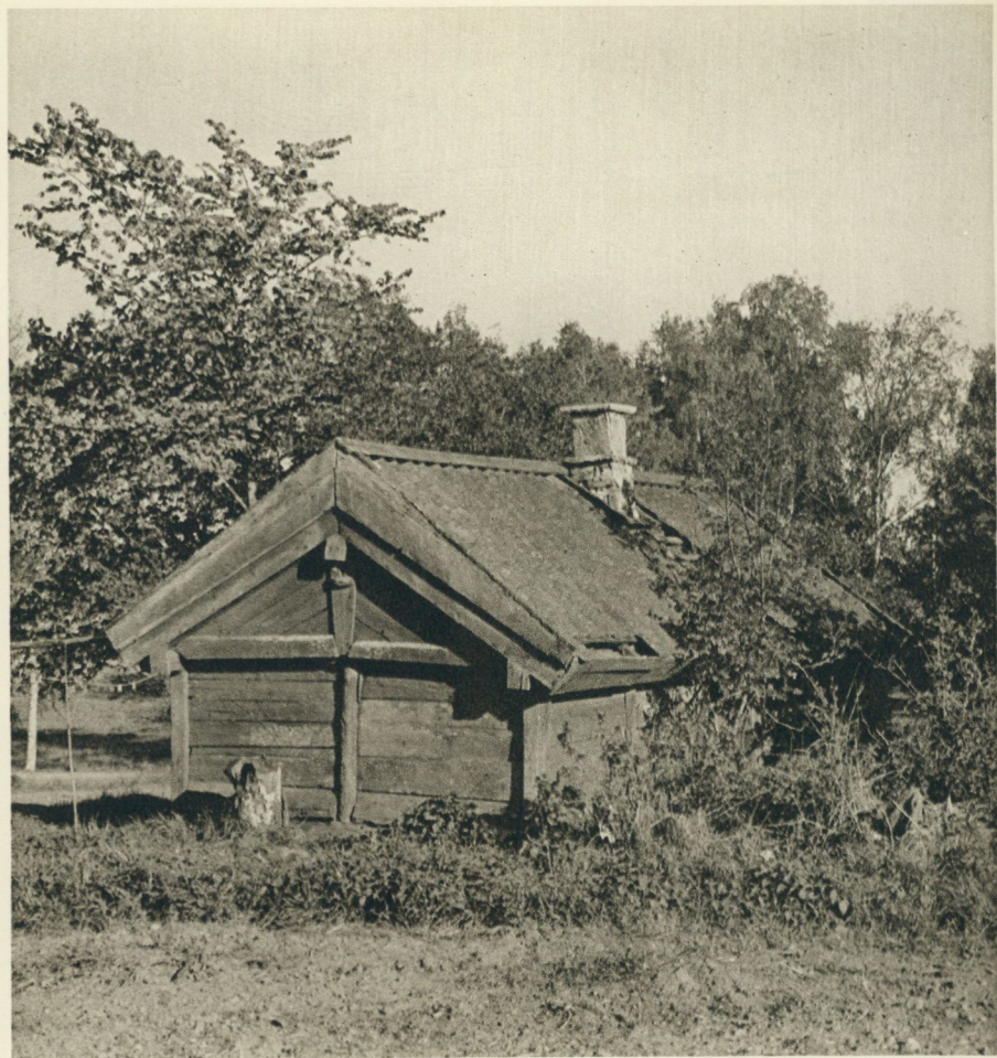
Vävar-Lars gamla ryggåsstuga, Hålgården, var allt som återstod av Trestena gamla by. »Larsa-stöva» var visserligen gammal och ganska fallfärdig, men där var alltid pyntat och fint.