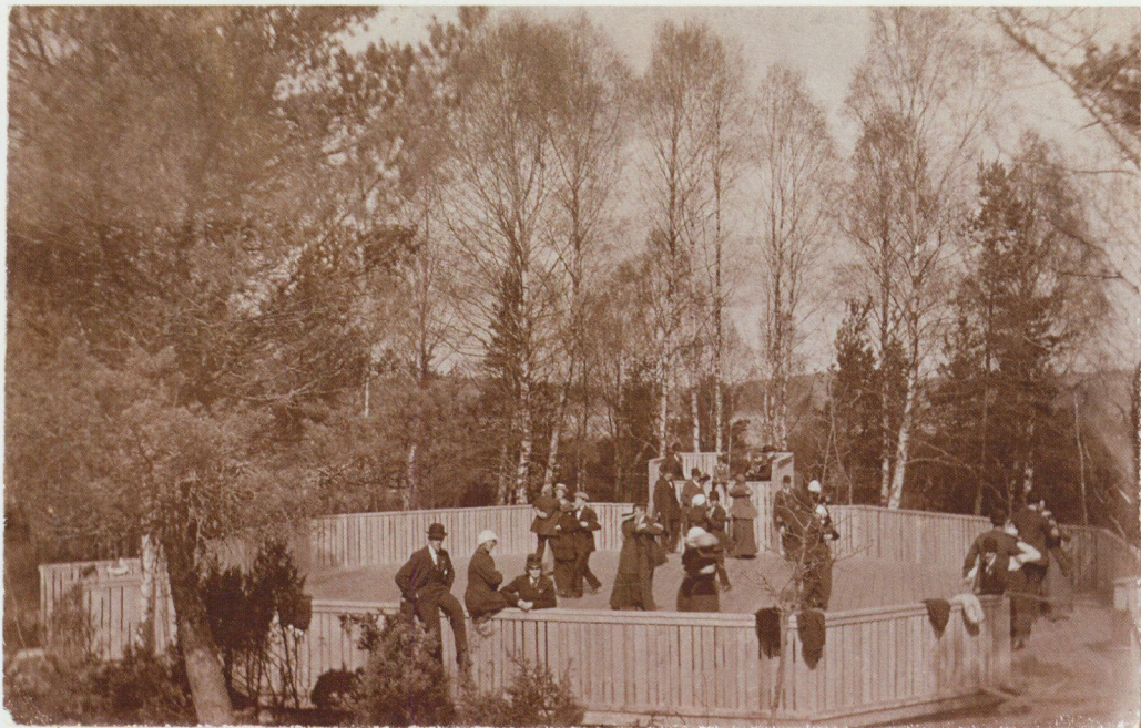
Debatterad dans som nu är levande kulturhistoria. Dansbanan, Folkets Park. Alingsås, 13 maj 1915.

På Galejan satsar vi ordentligt på dans i sommar. Vi kommer också att erbjuda danskurser i bl.a. tango. Skansens folkdanslag är populärare än någonsin. Dansorkestern har alltid spelat kvällens sista dans, för att nästa dag återigen sprida glädje någon annanstans. Så kommer det att förbli. Jag hoppas få bjuda upp till dans på Galejan i sommar!