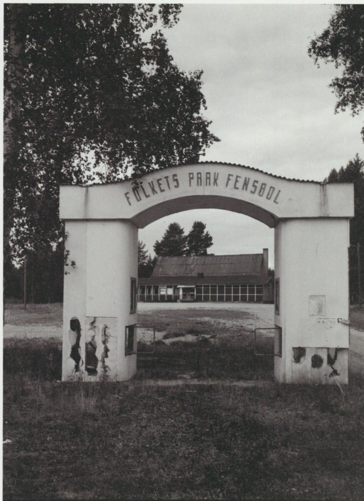
Folkets Park i Fensbol 10 augusti 1994.