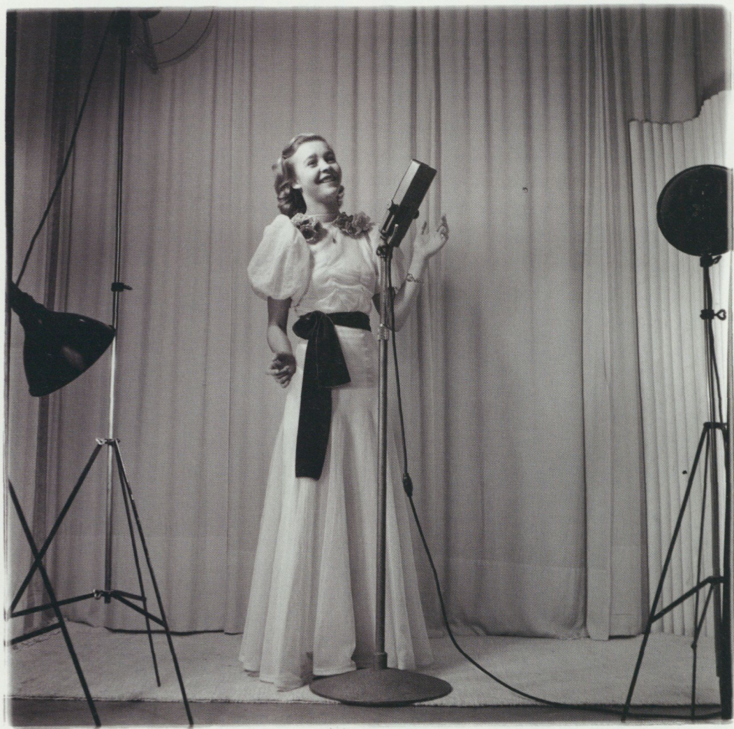
Alice Babs.