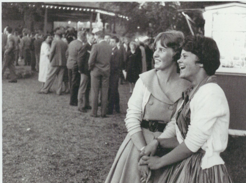
Lidköpings Folkets Park 1950.

De attacker som rockmusiken utsattes för när den kom på 50-talet var likartade. De handlade om det skadliga i upphets-