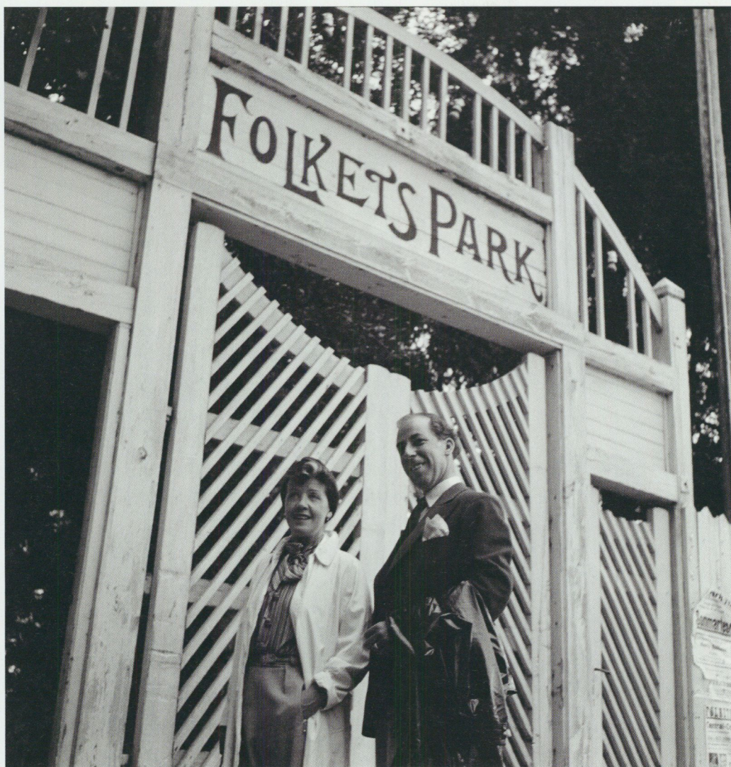
Folkets Park i Flen, 1940.