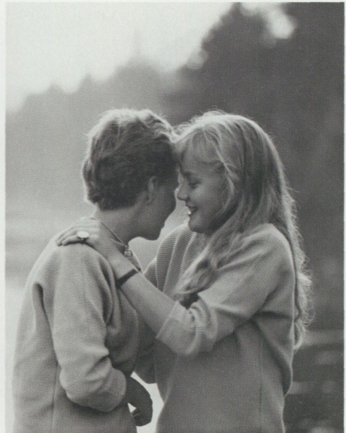
Två och två.