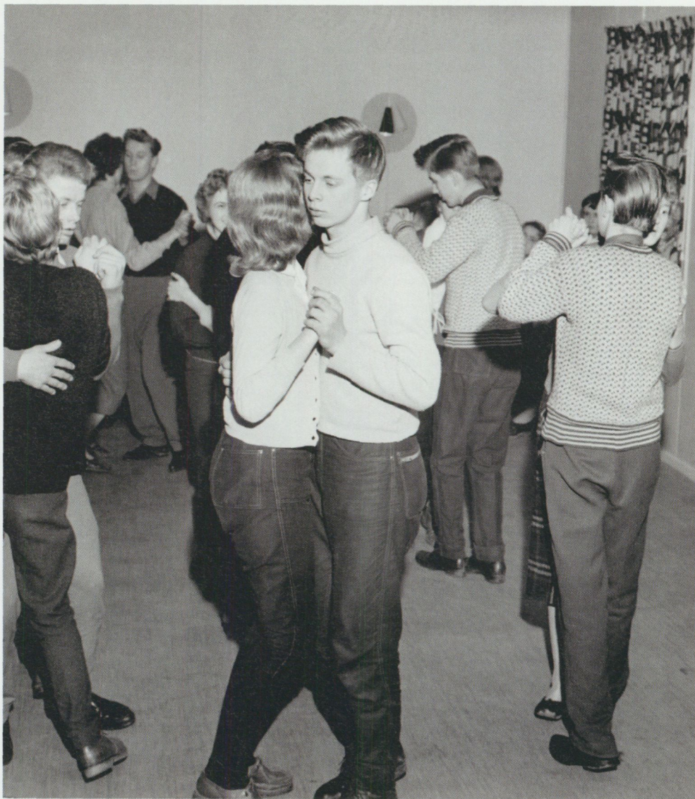
Par om par.