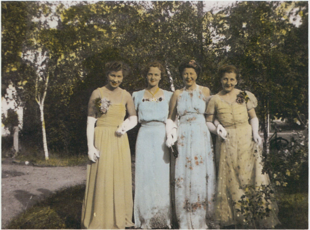
Kanske på väg till fest med tidens moderna dans. Alingsås ca 1940.