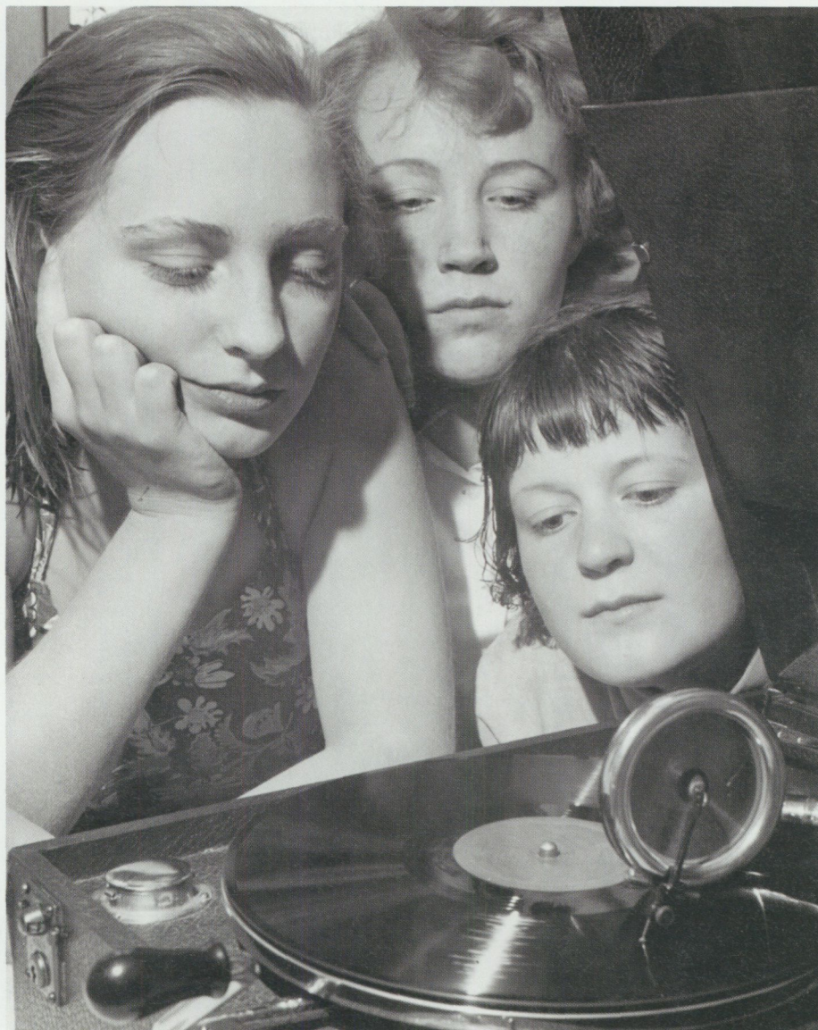
Grammofonskivornas tid.