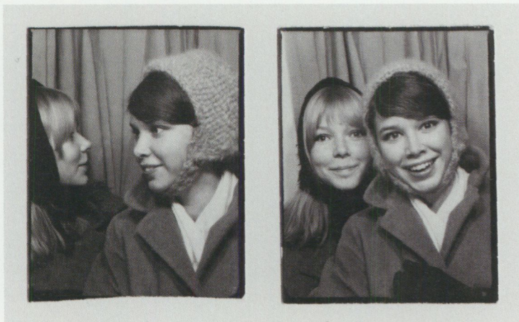
Artikelförfattaren t.v. med kamrat på väg från förorten till disko i stan på 1960-talet. Förberedelserna förevigades i fotoautomaten.

Men sen kom ju i alla fall twist och shake och disko också i mitt liv. Och resan till Frankrike där man dansade »le jerk« som minsann inte bara var vanlig shake. Att flickor dansade med flickor var inte ovanligt hemma i Sverige men i Frankrike dansade också pojkar med pojkar. Diskoteken var den nya världen i mitt liv, men utan mina positiva erfarenheter från ABF kanske jag aldrig hade vågat mig dit. Och om jag inte hade haft så roligt på diskoteken kanske den första danskursen hade framstått på ett helt annat sätt i mitt minne.