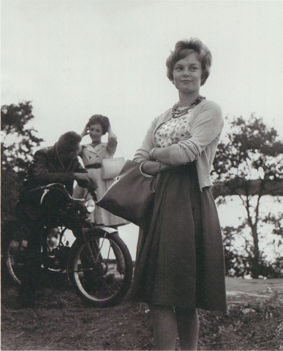
Sällskap hem?