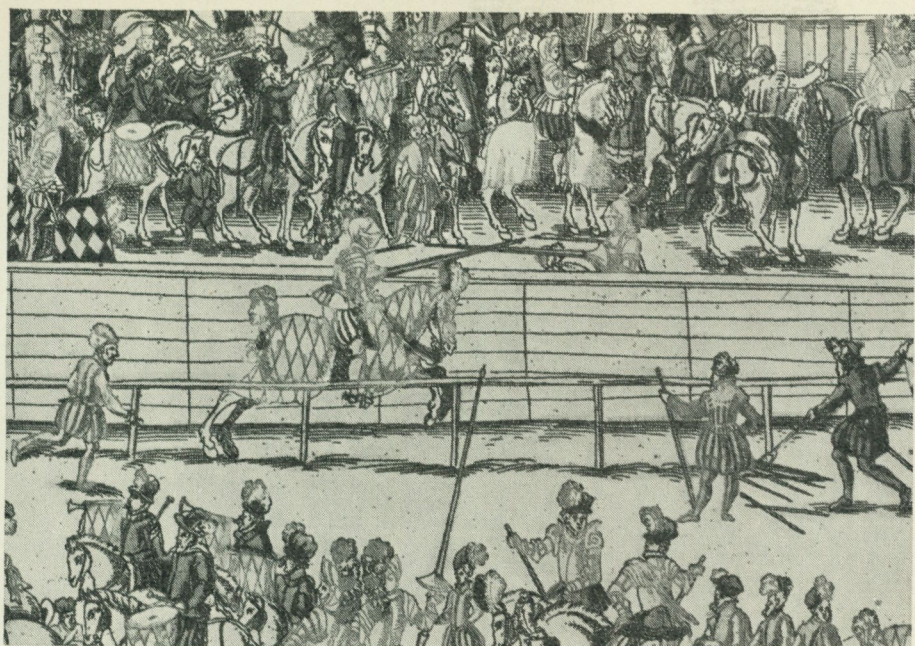
Bild 4. Skranktornering. Motståndarna rida mot varandra på ömse sidor om en barriär. Färglagt kopparstick ur Hans Wagner, Kurtze doch gegründte beschreibung etc., München 1568.