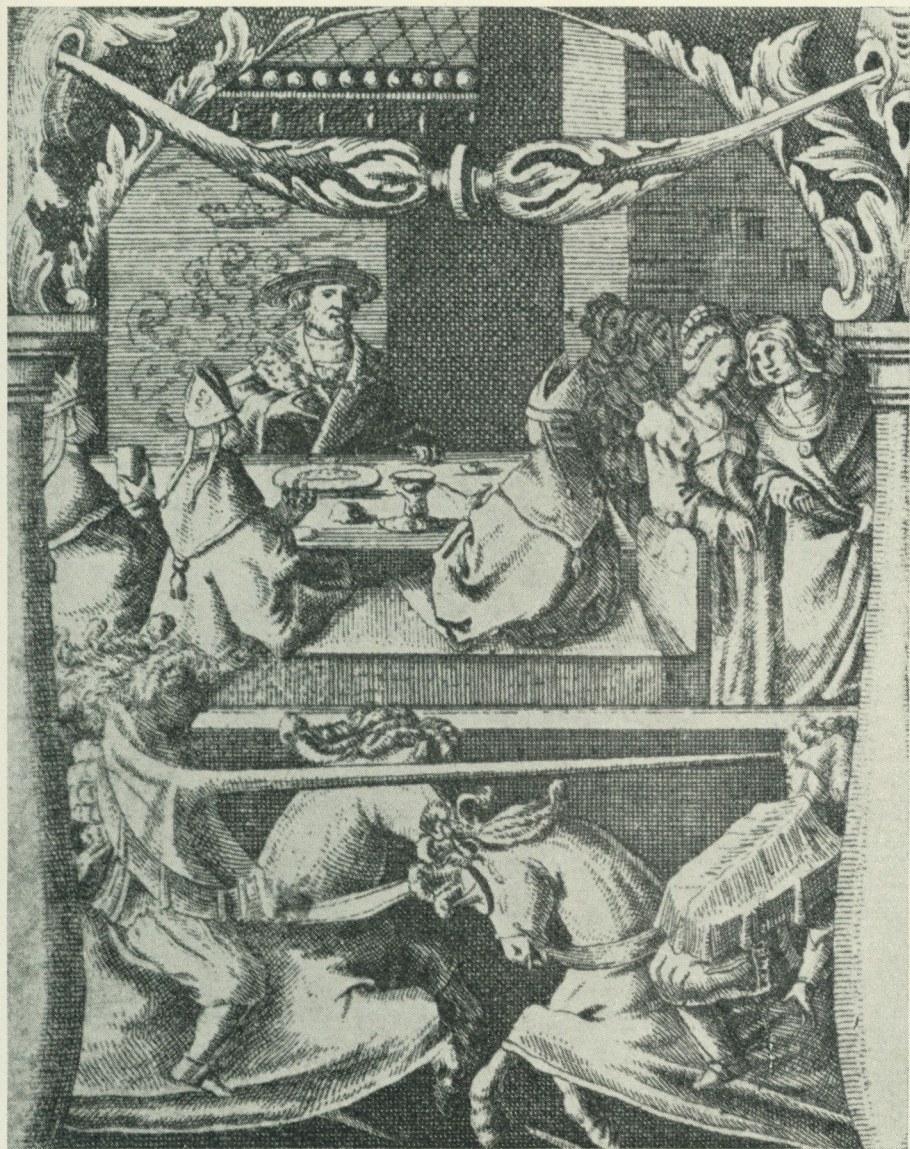
Bild 1. Tornering i Stockholm vid Kristian Tyranns kröning 1520. Detalj av ett kopparstick av Padt-Brugge från 1600-talet, som dock återgår på ett nu förlorat träsnitt från 1524.