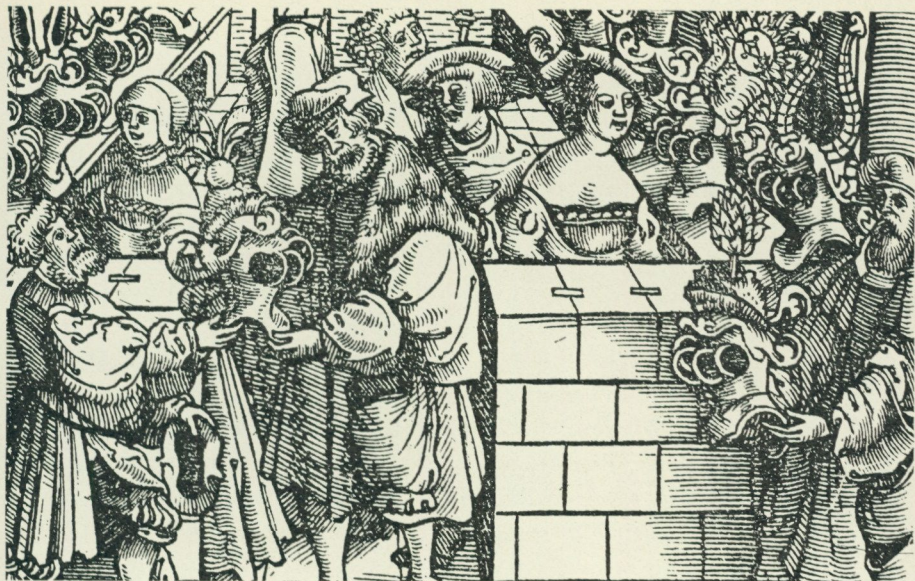
Bild 6. Hjälmarna med sina hjälmtecken kontrolleras av domarna och ställas ut dagen före torneringen. Detalj av träsnitt i G. Ruxner, Anfang, Ursprung und Herkommen des Thurniers etc., Siemern 1532.