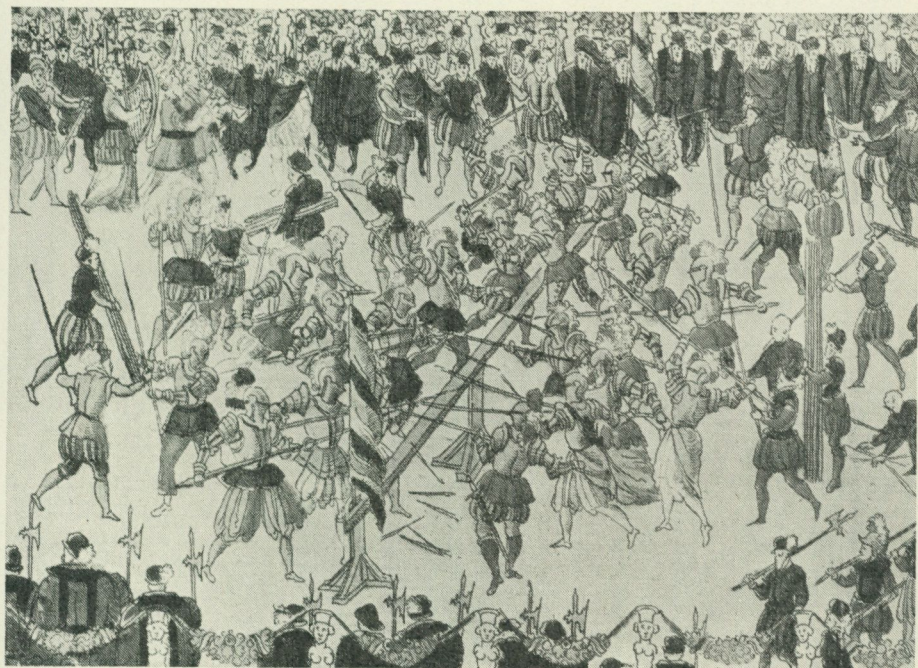
Bild 5. Tornering till fots över en barriär. Närmast kämpar man med lans, där bakom med svärd. Ur samma arbete som föregående.