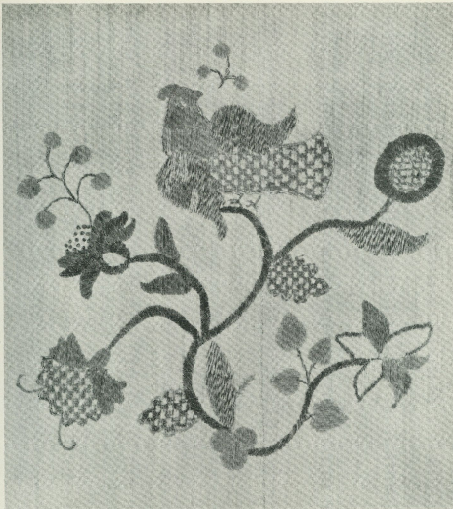
Bild 7. Detalj av ett broderat hängkläde från Asarums socken i Blekinge. Hela färgytan i ensidig plattsöm och olika botten-sömmar ersätta den mera krävande schattersömmen. Två toner blått, rosa och något gult är här liksom alltid i hängkläderna de enda använda färgerna. Nordiska museet 199,598.