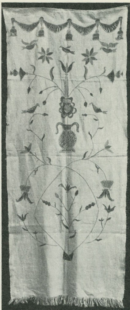
Bild 5. Hängkläde daterat 1806, tillhör den äldsta mycket litet kända traditionen före förnyelsen omkring 1820. Nordiska museet 120,285. — Bild 6. Ett hängkläde av det enklaste slaget, konstillöst tecknat och illa sytt. Zickermans bildverk 6,250.