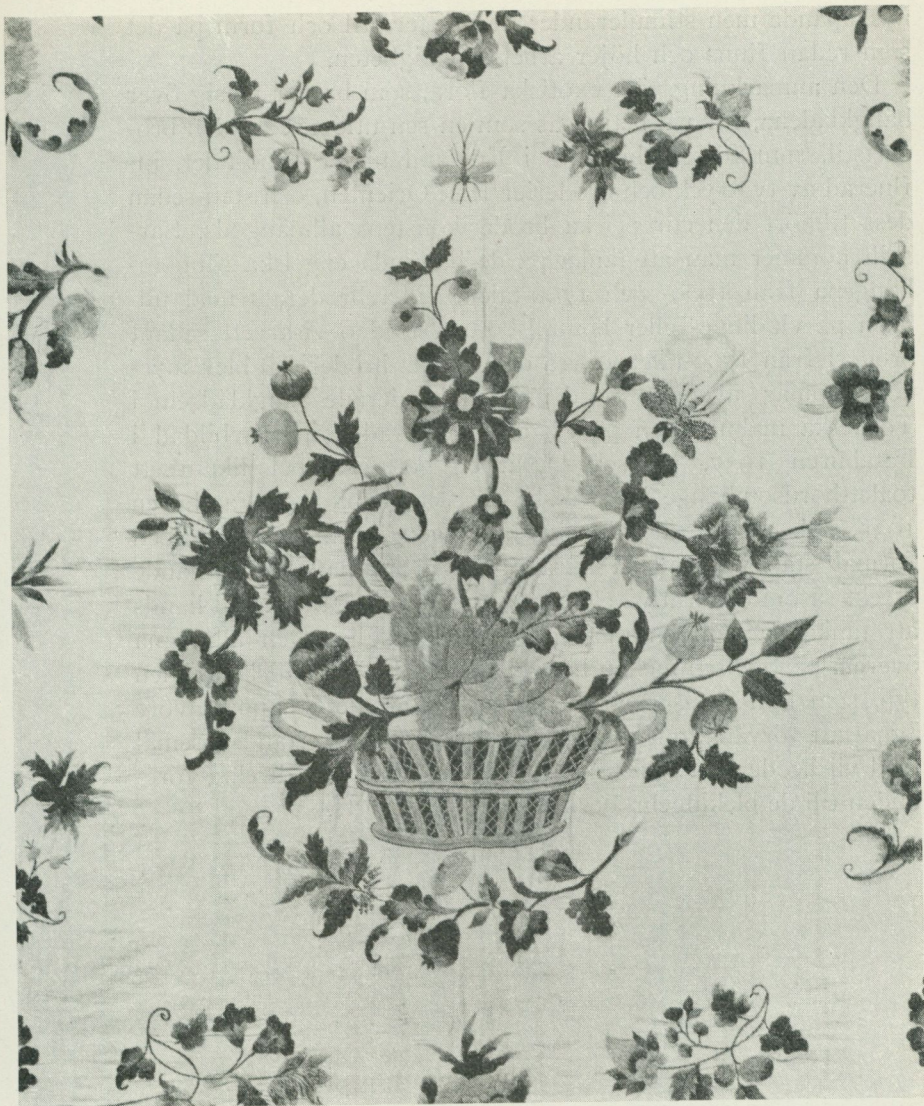
Bild 9. Detalj av ett täcke från 1700-talets början. Broderi med ullgarn på linne. Engelskt arbete. Victoria and Albert Museum, London.