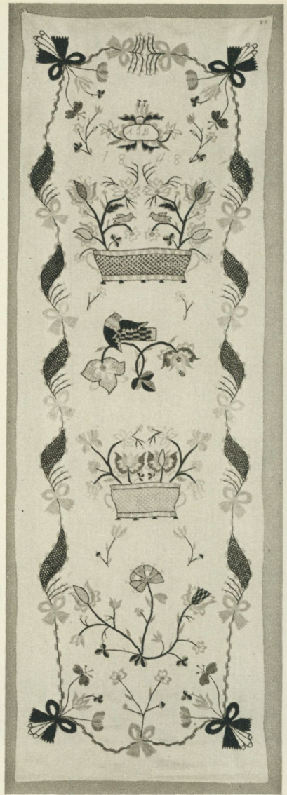
Bild 3. Hängkläde från Hällaryd, typiskt för grupp III. Daterat 1835. Nordiska museet 16,197. — Bild 4. Hängkläde ur grupp IV, daterat 1848. Nordiska museet 232,890.