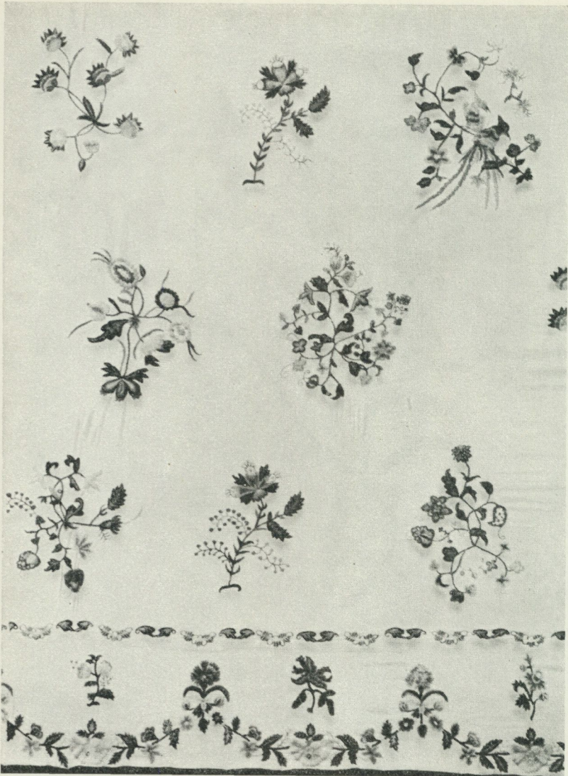
Bild 8. Detalj av ett sängomhänge från 1700-talets förra hälft. Broderi med ullgarn på linne. Svenskt arbete. Nordiska museet 207,051.